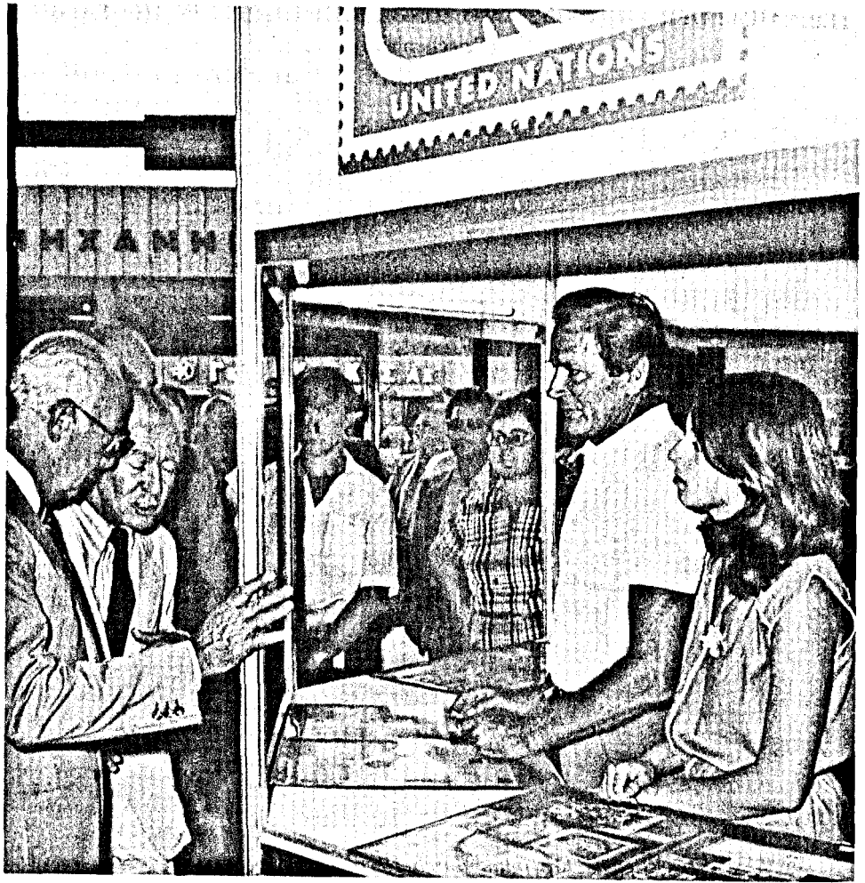
. . . und überraschender Besuch des griechischen Ministerpräsidenten, Herrn G. Rallis (links)